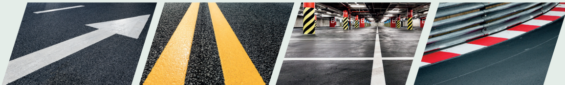
ลูกศรบอกทาง