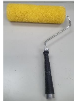
1.4 ลูกกลิ้งรังผึ้ง (Sakotsu Roller)