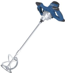
1.5 เครื่องปั่นผสมสี (Hand mixer)