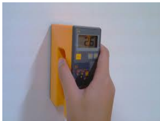
เครื่องวัดความชื้นรุ่น HI-520

สำหรับพื้นผิวใหม่: (ทิ้งปูนแห้งตัวไม่ต่ำกว่า 28วัน) พื้นผิวต้องสะอาดไม่มีฝุ่น สิ่งสกปรก คราบไข สิ่งแปลกปลอม ต้องมีค่าความชื้นไม่เกิน 6% (วัดด้วยเครื่อง HI-520) หรือ 14% (วัดด้วยเครื่อง Protimeter Mini) และต้องมีค่าความเป็นด่างไม่เกิน 8