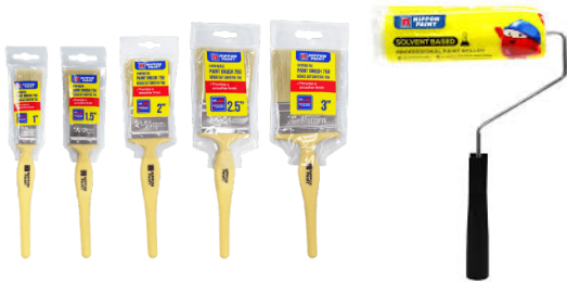
1.3 แปรงทาสีและลูกกลิ้ง (Brush & Roller)