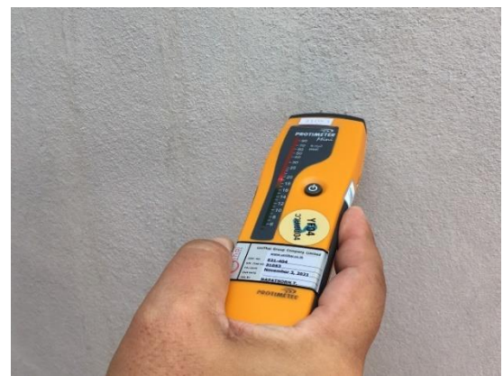
เครื่องวัดความชื้นรุ่น Protimeter Mini