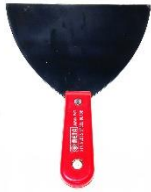
1.1 เครื่องโป้ว (Trowel)