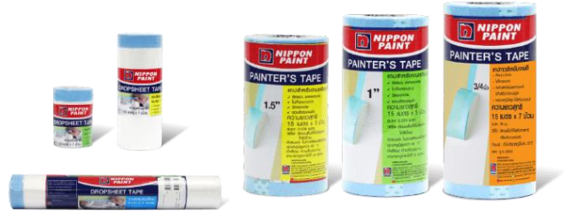
1.2 อุปกรณ์ปกป้องผนัง (Drop sheet Tape & Painter Tape)