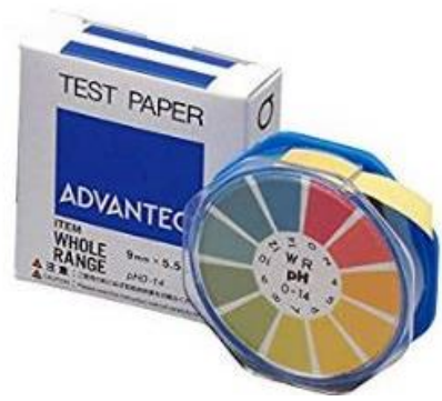
กระดาษวัดค่าความเป็นด่าง